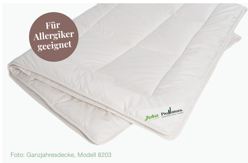
Foto: Ganzjahresdecke, Modell 8203